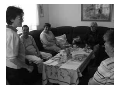
Program s p. Herinkovou