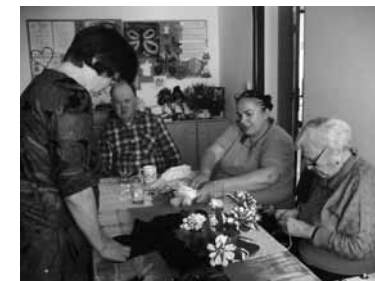
Ruční práce v DS