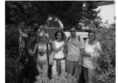
Výlet do ZOO Lešna s uživateli DS