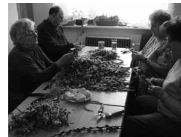
Vázání kočíček v DS