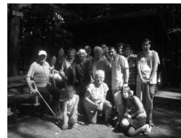
Výlet na Provozdov