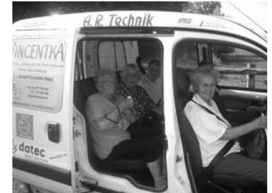
První výlet sociálním automobilem