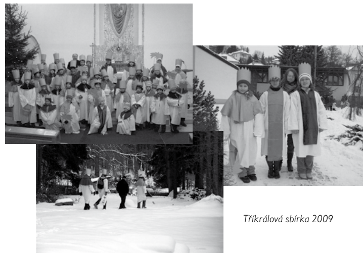
Tříkrálová sbírka 2009

Charita na povodně 57.715,- Kč Finanční prostředky byli a jsou shromažďovány v hotovosti na Charitě Svaté rodiny Luhačovice. Vybrané částky jsou pak hromadně odesílány na příslušná konta Charity České Republiky.