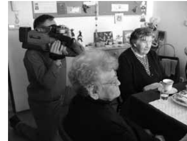
Kamera v Denním stacionáři