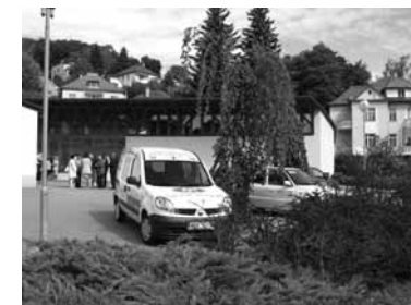
Charitní auta pečovatelské služby