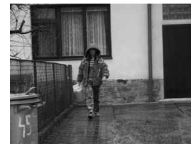
Pečovatelská služba v terénu