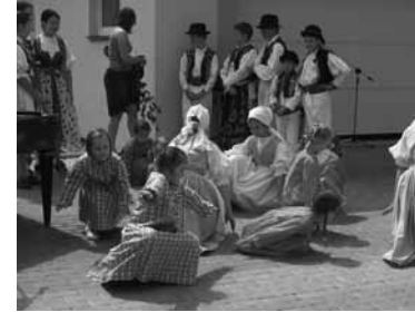
Soubor malé Zálesí - 5 Let Charity