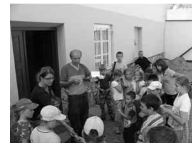
Týden s Charitou