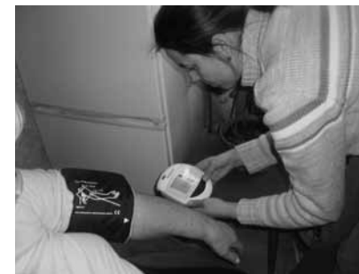
Zdravotní sestra při měření tlaku

Charitní ošetrovatelská služba poskytuje komplexní ošetrovatelskou domácí péči v domácím prostředí.