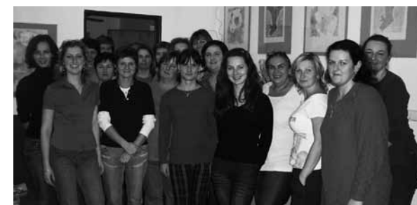
Pracovníci Charity Luhačovice