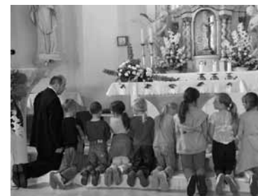
Dětská pouť na Provodov

Všem našim dobrovolníkům, kteří se jakýmkoli způsobem podílejí na činnosti a dalších aktivitách Charity Svaté rodiny Luhačovice, patří obrovské poděkování za nadšení a čas, který věnují druhým lidem. Za jejich pomoc všem těmto spolupracovníkům mnohokrát děkujeme!!!