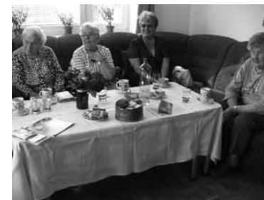
Beseda v DS