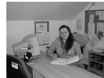
Pracovnice Poradny SPOLU

Bližší popis cílů a principů všech služeb Charity Luhačovice najdete na letáčích či na internetových stránkách www.luhacovice.caritas.cz .