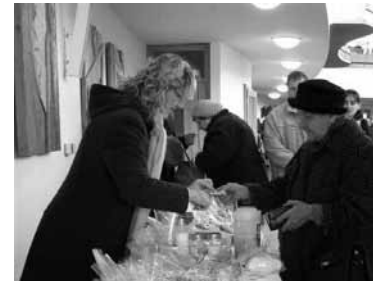
Bazárek vánočního cukroví