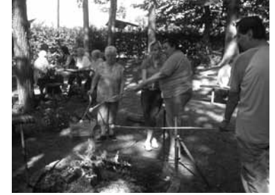
Táborák na Myslivecké chatě s uživateli DS a obyvateli Domu s pečovatelskou službou STRAHOV