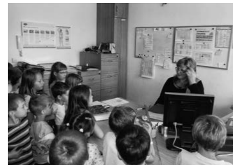
Exkurze dětí z Mateřské školky v Luhačovicích v Pečovatelské službě