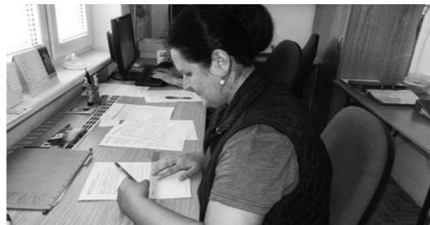
Pracovnice Charitní pečovatelské služby

Naším cílem je poskytnout kvalitní péči a podporu soběstačnosti dle potřeb a přání klienta a prohloubit v něm pocit jistoty a bezpečí. Chceme podpořit jeho snahu vést samostatný život v domácím prostředí v co možná nejširším rozsahu.