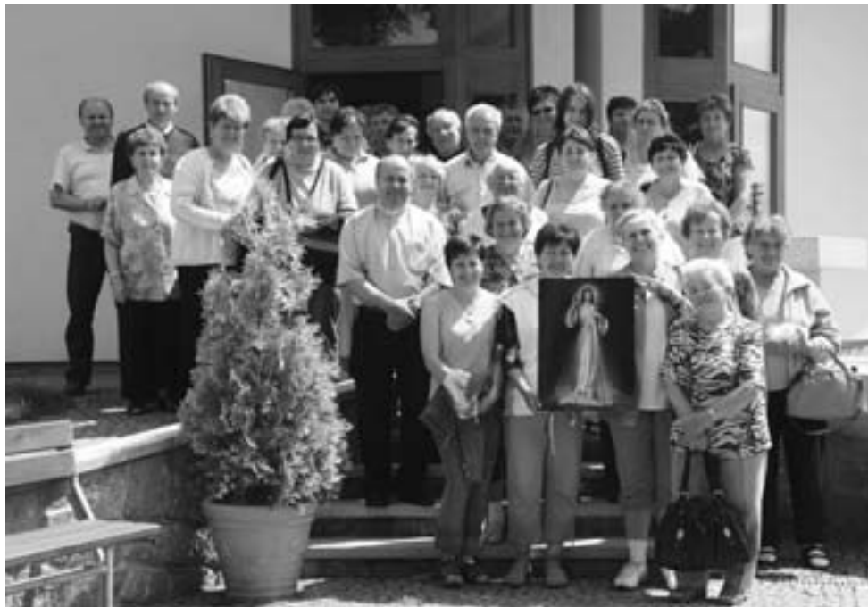
Charita Svaté rodiny Luhačovice spolu s Římskokatolickou farností uspořádala 22. června 2011 pouť do Slavkovic u Nového Města na Moravě a Žarošic.

„Neboť jsem hladověl, a dali jste mi najíst, žíznul jsem a dali jste mi pít, byl jsem na cestách, a ujali jste se mne, byl jsem nahý, a oblékli jste mne, byl jsem nemocen, a navštívili jste mne, byl jsem ve vězení, a přišli jste za mnou.“ (Mat 25, 35-36)