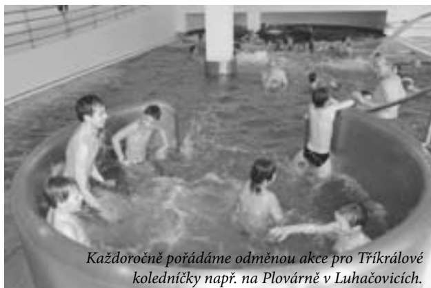
Každoročně pořádáme odměnou akce pro Tříkrálové koledníky např. na Plovárně v Luhačovicích.

Pravidelná dobrovolnická činnost - v průběhu roku se dobrovolníci střídají a pomáhají při aktivizačních programech v Denním stacionáři pro seniory a v Domě s pečovatelskou službou Strahov. Pořádáme programy pro seniory, zdravotně postižené a jejich přátele za pomoci dobrovolníků a spolupracujeme s místními organizacemi (Městská knihovna, DDM Luhačovice, Muzeum Jihovýchodní Moravy Zlín aj.).