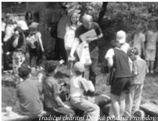
Tradiční charitní Děťká pout' na Provodov.

Zpracoval: Mgr. Karel Adámek, koordinátor dobrovolníků