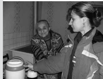
Pečovatelská služba v terénu