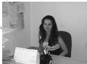
Pracovnice Poradny SPOLU

Případní zájemci o služby poradny SPOLU nás mohou osobně navštívit v provozní době, případně si domluvit telefonicky nebo emailem návštěvu přímo s pracovníci poradny.