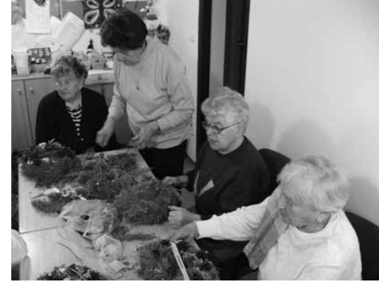
Výroba adventních věnečků