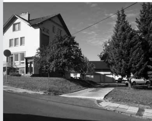
Areál Charity Svaté rodiny Luhačovice