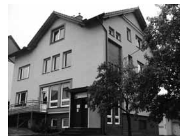
Budova Charity Luhačovice

Každý sponzorský dar pomáhá zlepšit podmínky naší práce, a tedy i kvalitu péče o naše uživatele. Jsme proto vděční i za ty nejmenší příspěvky. Díky sponzorům můžeme zapůjčovat rehabilitační a kompenzační pomůcky, využívat rychlejší výpočetní techniku pro mnohem rychlejší a kvalitnější zpracování dokumentace pro lékaře a Všeobecnou zdravotní pojišťovnu apod. Máte-li možnost a můžete-li pomoci svými sponzorskými dary situaci lidí v nouzi zlepšit, jsme Vám velmi vděční a naložíme s těmito příspěvky dle Vašeho přání. Podporujeme také zahraniční humanitární pomoc. Na každý dar poskytneme smlouvu nebo vystavíme potvrzení o převzetí Vašeho daru.