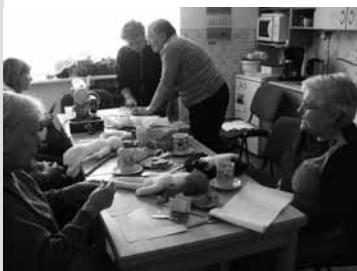
Aktivizační program výroby panenek pro UNICEF