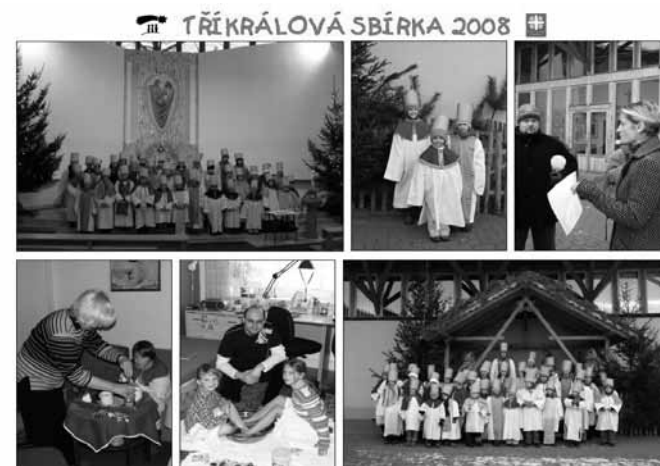
Tříkrálová sbírka 2008

Finanční prostředky byli a jsou shromažďovány v hotovosti na Charitě Svaté rodiny Luhačovice. Vybrané částky jsou pak hromadně odesílány na příslušná konta Charity České Republiky.