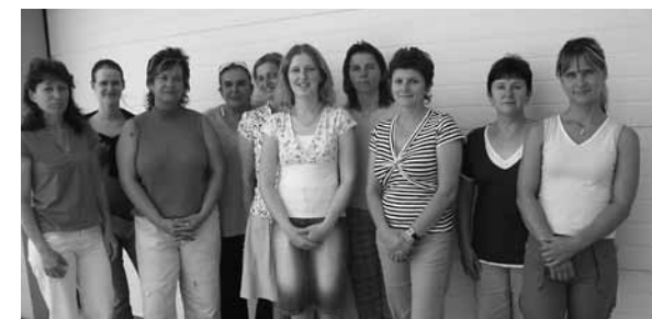
Pracovníci Charity Luhačovice