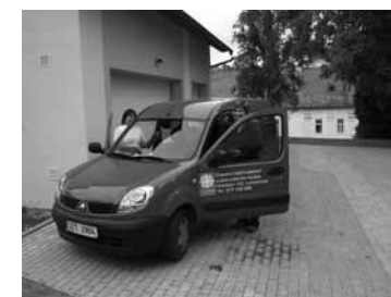
Auto Charitní ošetřovatelské a pečovatelské služby