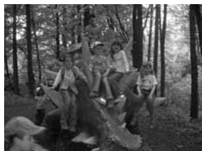
Výlet do Dinoparku Vyškov pro TKS koledníčky