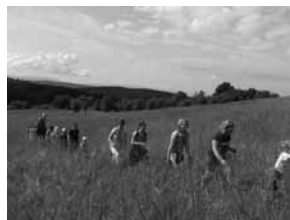
Dětská pout' na Provodov