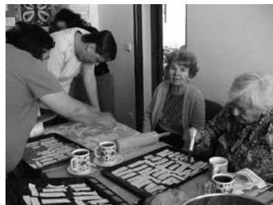
Aktivity Denního stacionáře