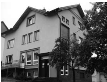
Budova Charity Luhačovice

Každý sponzorský dar pomáhá zlepšit podmínky naší práce, a tedy i kvalitu péče o naše uživatele. Jsme proto vděční i za ty nejmenší příspěvky. Díky sponzorům můžeme zapůjčovat rehabilitační a kompenzační pomůcky, využívat rychlejší výpočetní techniku pro mnohem rychlejší a kvalitnější zpracování dokumentace pro lékaře a Všeobecnou zdravotní pojišťovnu apod. Máte-li možnost a můžete-li pomoci svými sponzorskými dary situaci lidí v nouzi zlepšit, jsme Vám velmi vděční a naložíme s těmito příspěvky dle Vašeho přání. Podporujeme také zahraniční humanitární pomoc. Na každý dar poskytneme smlouvu nebo vystavíme potvrzení o převzetí Vašeho daru.