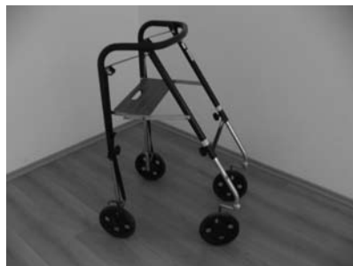
Ukázka rehabilitačních pomůcek