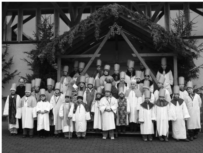
Tříkrálová sbírka 2007