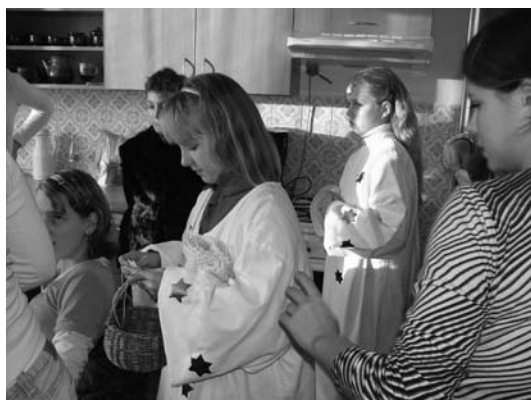
Mikuláš na charitě