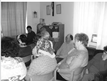
Program promítání filmu