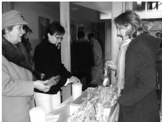
Bazárek vánočního cukroví