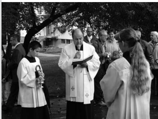
Svěcení sochy sv. Gottharda, Den otevřených dveří Charity Luhačovice