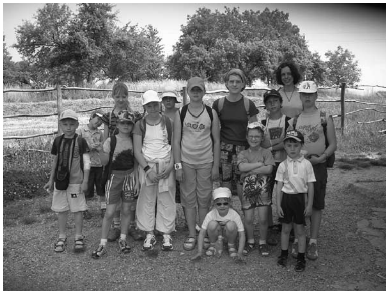
Výlet do Archeoskanzenu pro Tříkrálové koledníky

Je jedním z nejkrásnějších zadostiučinění tohoto života, že žádný člověk nemůže upřímně pomoci druhému, aniž by nepomohl i sám sobě.