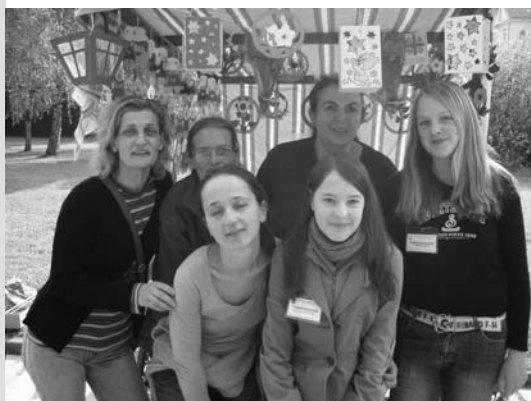
Dobrovolnice a pracovnice charity na Jarmarku