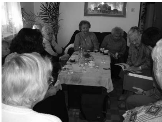
Beseda v DS