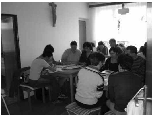
Výuka angličtiny v rámci Poradny SPOLU