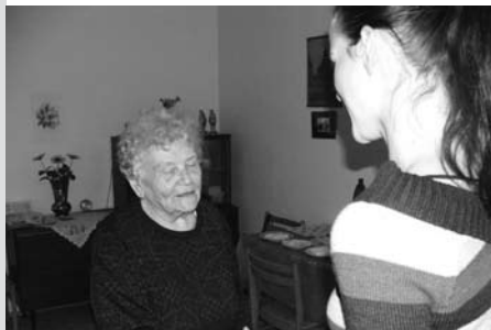
Blahopřejeme uživatelce k jubileu