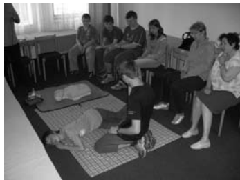
Školení první pomoci