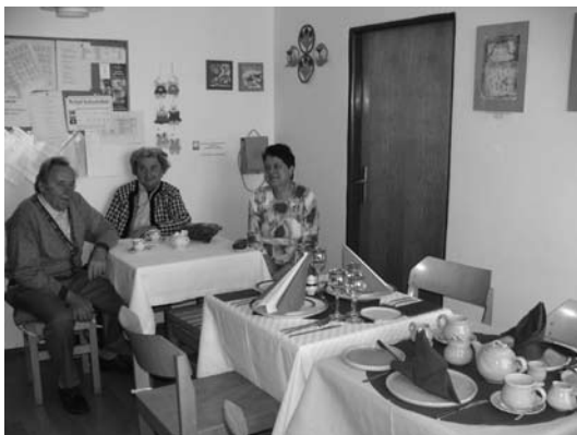
Program DS - Slavnostní prostírání