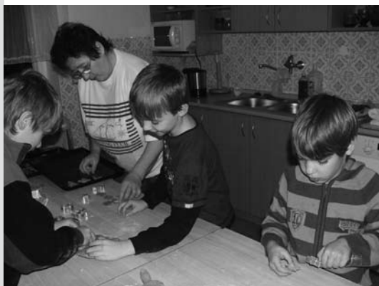
Pečení se skauty