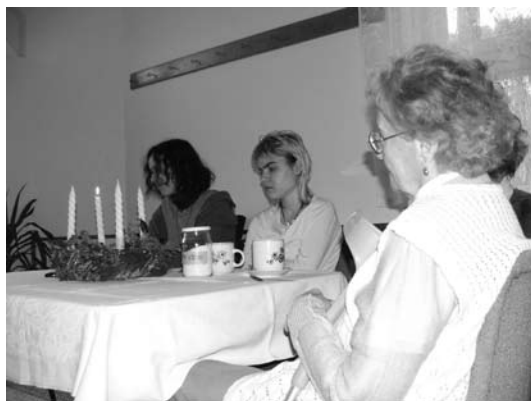
Advent na Strahově