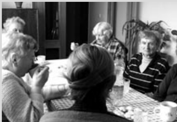
Program DS - STRAHOV