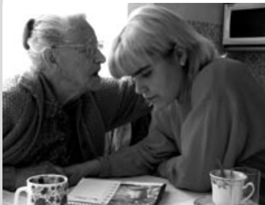
Uživatelé Denního stacionáře