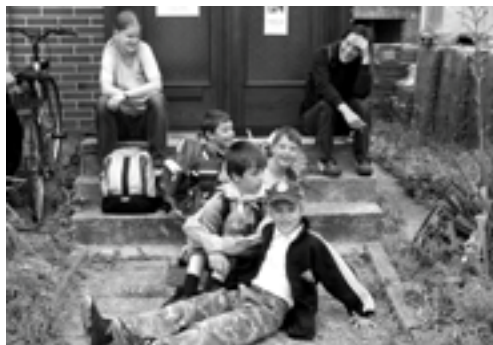
Výlet pro Tříkrálové koledníky se Skautským oddílem Luhačovice

DOBROVOLNÁ ČINNOST BYLA PODPOŘENA ZLÍNSKÝM KRAJEM