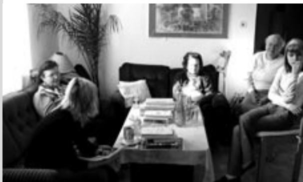
Program v DS