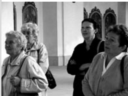
Poutě do Křtin u Brna“

Bez Vaší velkorysé přízně, osobního nasazení a motlíteb by Charita nemohla naplňovat své poslání – pomáhat těm, kdo se bez pomoci druhých neobejdou.