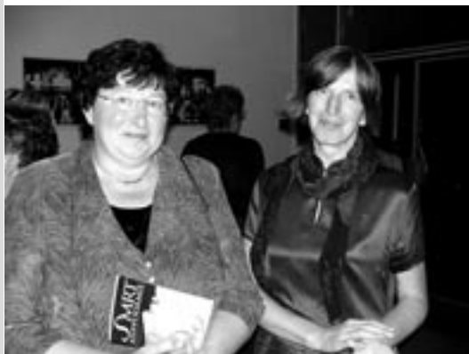
Návštěva divadla SMRT HIPODAMIE