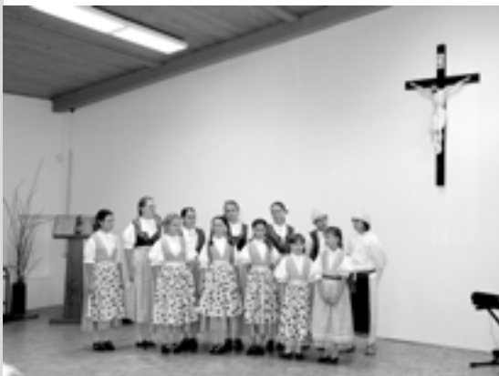
Adventní festival folklórní soubor Luhačovické Zálesí