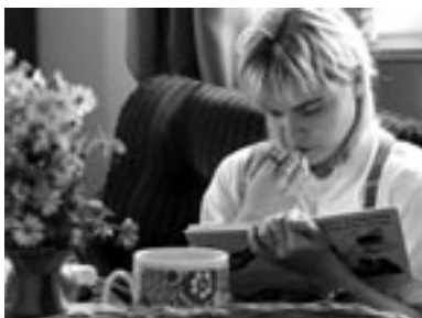
Život v DS