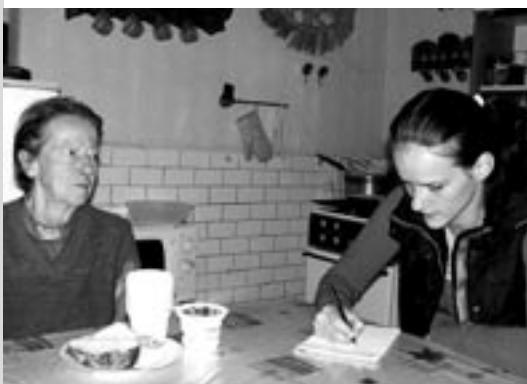
Naše pracovnice na sociálním šetření