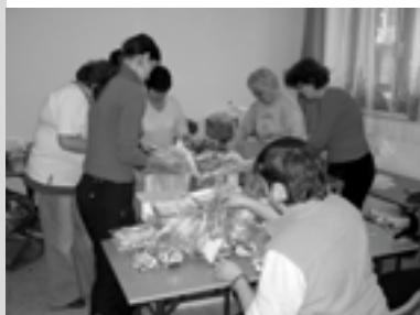
Dobrovolníci při akcích

• Sbírka šatstva a domácích potřeb pro Diakonii Broumov: 11 dobrovolníků (příjem, třídění, balení a nakládání šatstva)