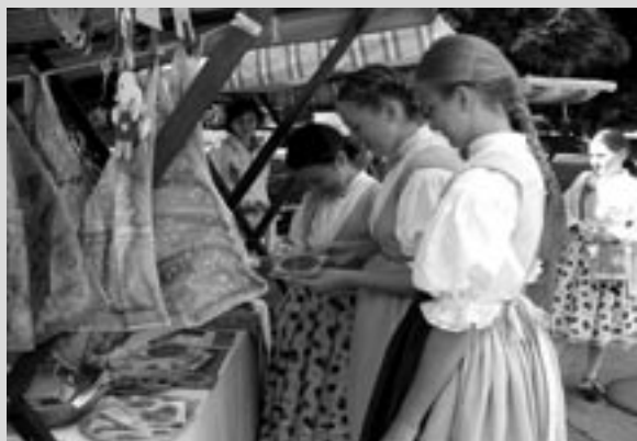
Stánek s výrobky DS