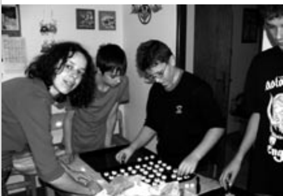
Dobrovolníci pečou cukroví pro dobročinnou sbírku

„Bůh používá obyčejných lidí k uskutečnění neobyčejných věcí.“