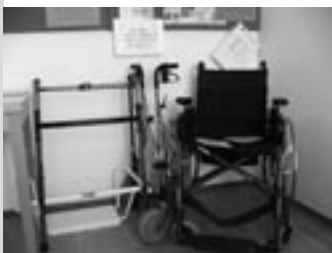
Ukázka zdravotních a rehabilitačních pomůcek

Počet uživatelů půjčovny v roce 2006: 85 uživatelů