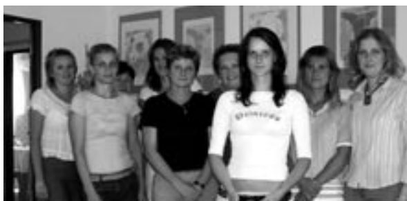
Pracovníci Charity Luhačovice