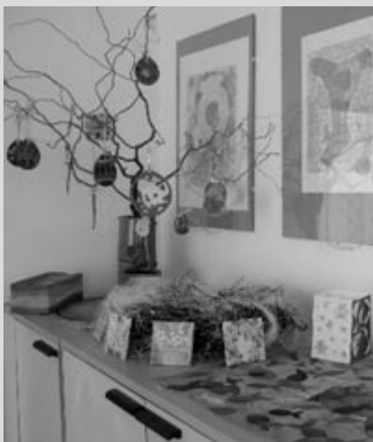
Vyrobené dekoráční předměty