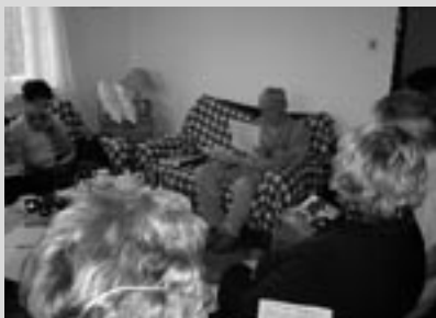
Přednáška o bylinkách