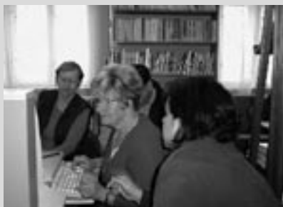
PC kurz pro seniory v knihovně