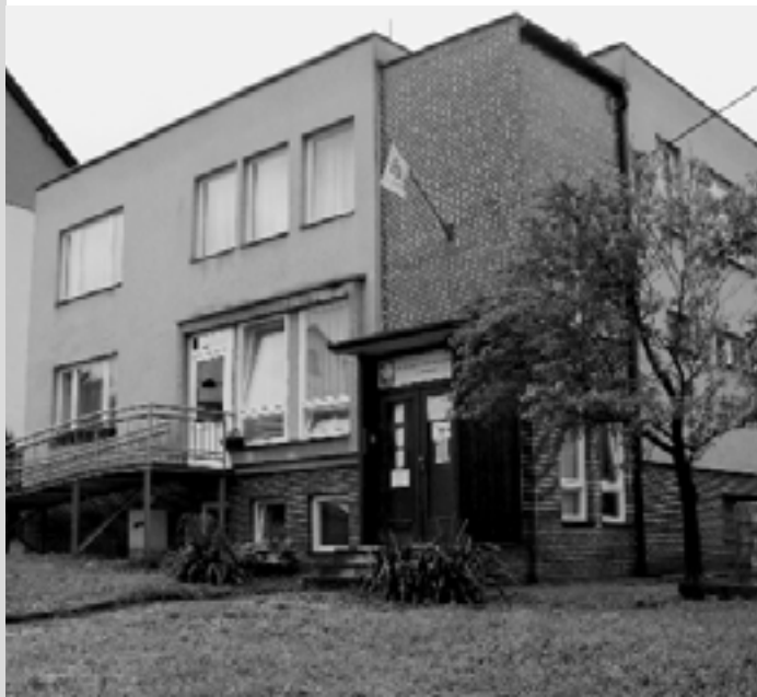
Budova Charity Luhačovice

Příspěvkový účet: ČSOB Zlín, 191151601/0300