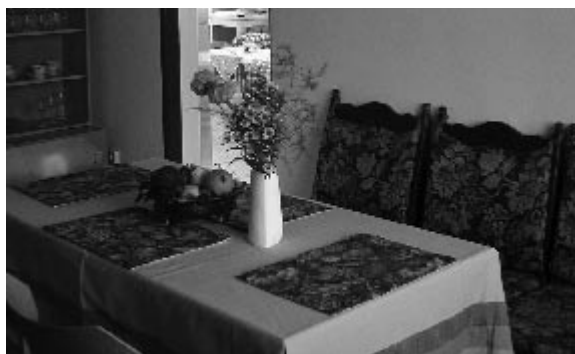
Prostory Denního stacionáře