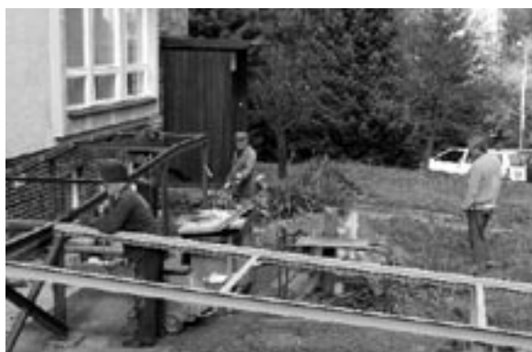
Výstavba bezbariérového vchodu (listopad 2005)