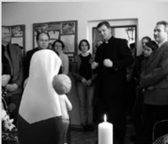
Slavnostní svěcení 13.2.2005