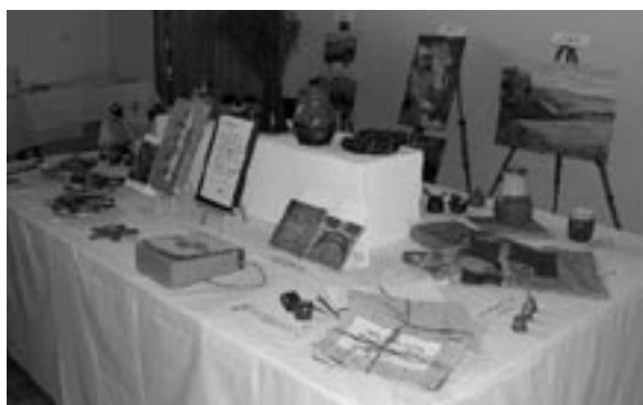
Výstava uměleckých předmětů (prosinec 2005)