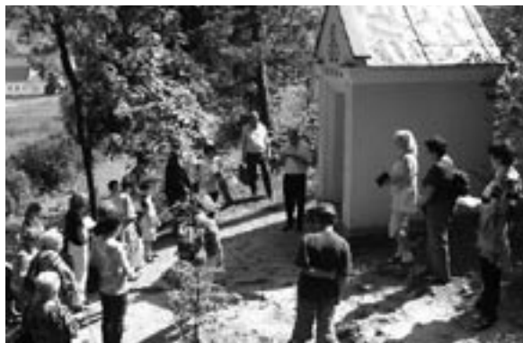
Pout' do Rájecké Lesné (srpen 2005)