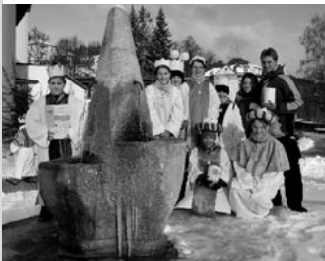
Tříkrálová sbírka 2005