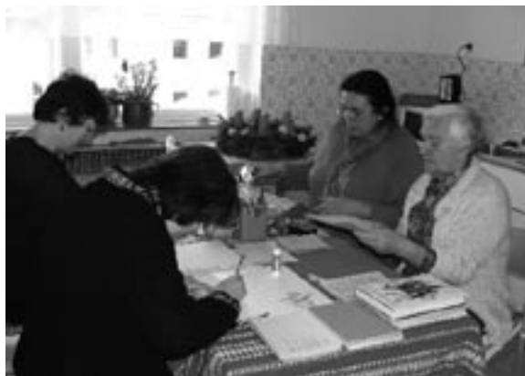
Činnost v denním stacionáři