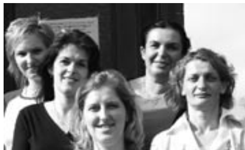
Pracovníci Charity Luhačovice

V roce 2005 v Charitě Luhačovice pracovalo celkem 12 pracovníků. 7 pracovníků v trvalém pracovním poměru a 2 pracovnice na nepravidelnou výpomoc, další na dohody o provedení práce.