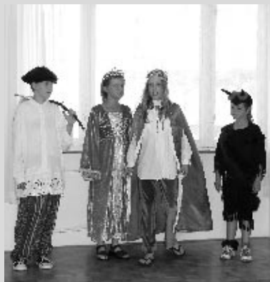
Den otevřených dveří - divadlo