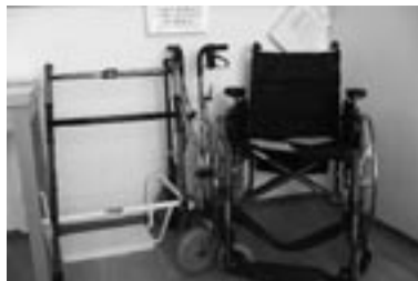
Ukázka zdravotních a rehabilitačních pomůcek

V rámci provozování půjčovny rehabilitačních a kompenzačních pomůcek nabízíme zapůjčení těchto pomůcek - berle, hole, chodítka pevná, chodítka pojízdná, závěsné sedačky do vany, sedačky do sprchy, WC křesla, nástavce na WC, mechanické invalidní vozíky, polohovací lůžka (elektrické, mechanické), antidekubitní matrace, antidekubitní pomůcky pod patu, loket... (vše proti proleženinám), stolky k lůžku, podložní mísy, močové láhve atd. Na základě přímé potřeby našich uživatelů jsou podle zájmu průběžně dokupovány potřebné zdravotní a kompenzační pomůcky.